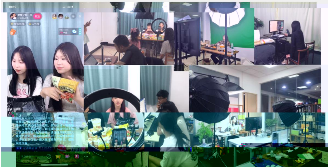
部份学员在进行电商直播实训场景