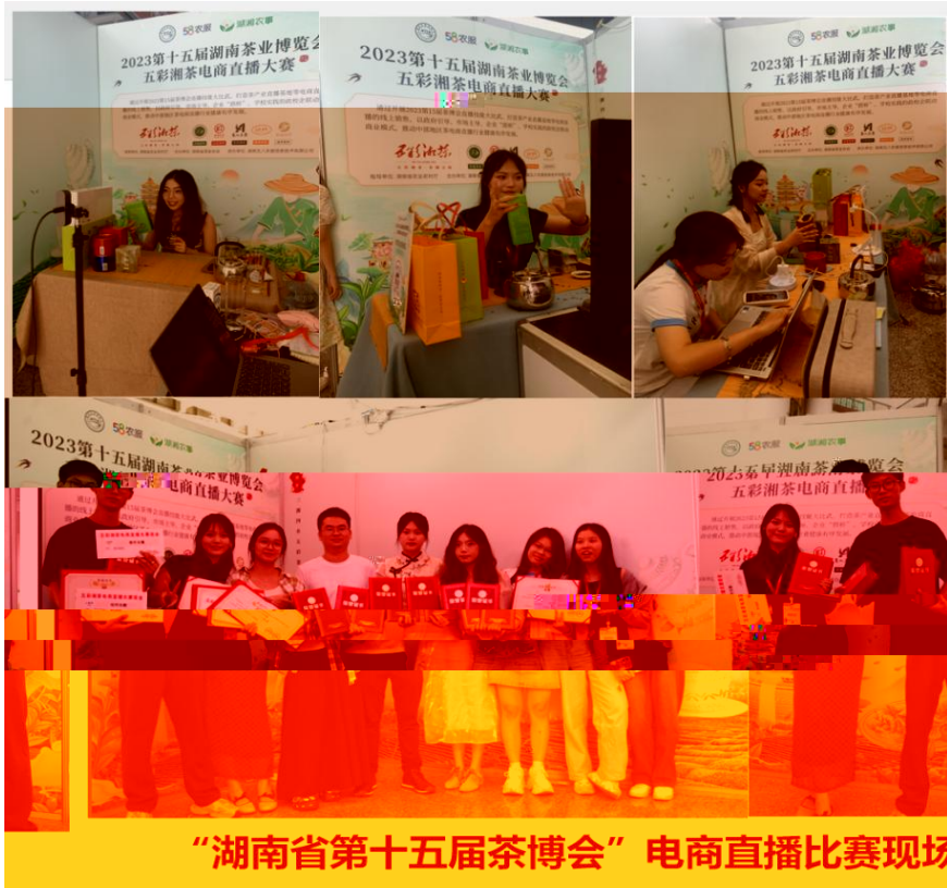
“湖南省第十五届茶博会” 电商直播比赛现场